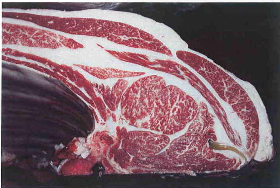
No 5 血統：秀菊安×糸北国 格付成績：脂肪交雑 4 A-5