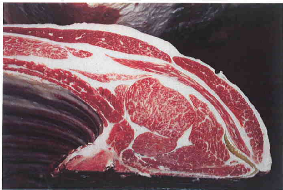
No 1 血統：糸北国×安平 格付成績：脂肪交雑 3 - A-5