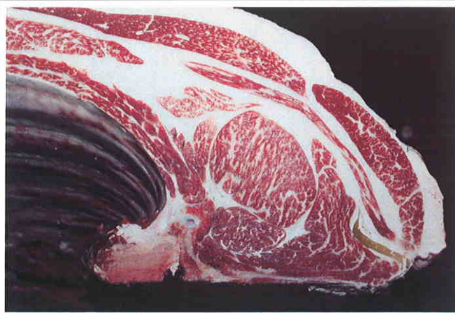
No 2 血統：福之国×安平 格付成績：脂肪交雑 4 A-5