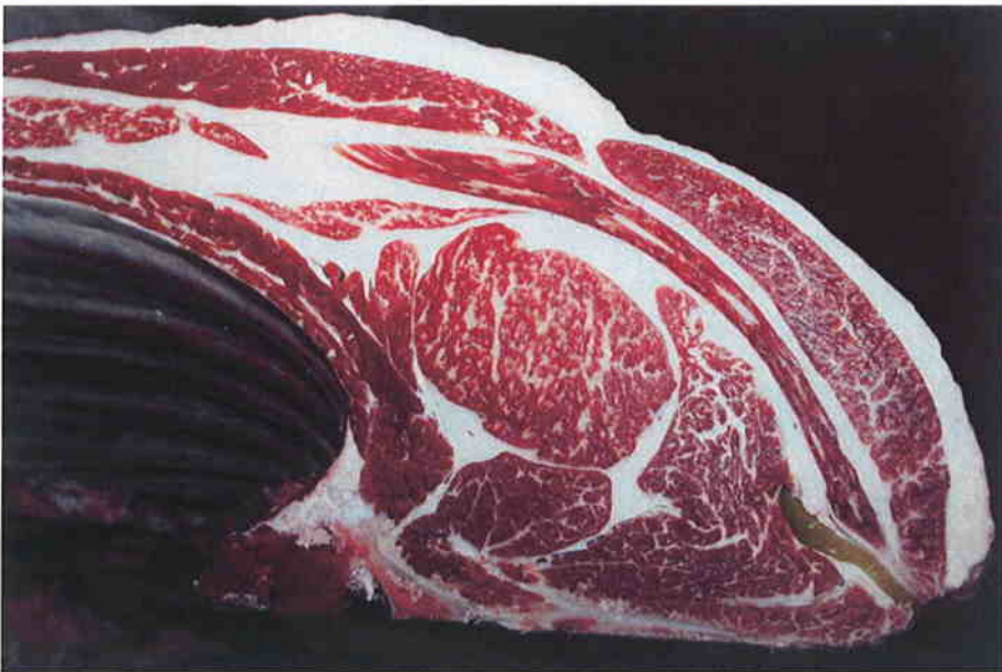
No 7 血統：勝平正×安平 格付成績：脂肪交雑 2 + A-5