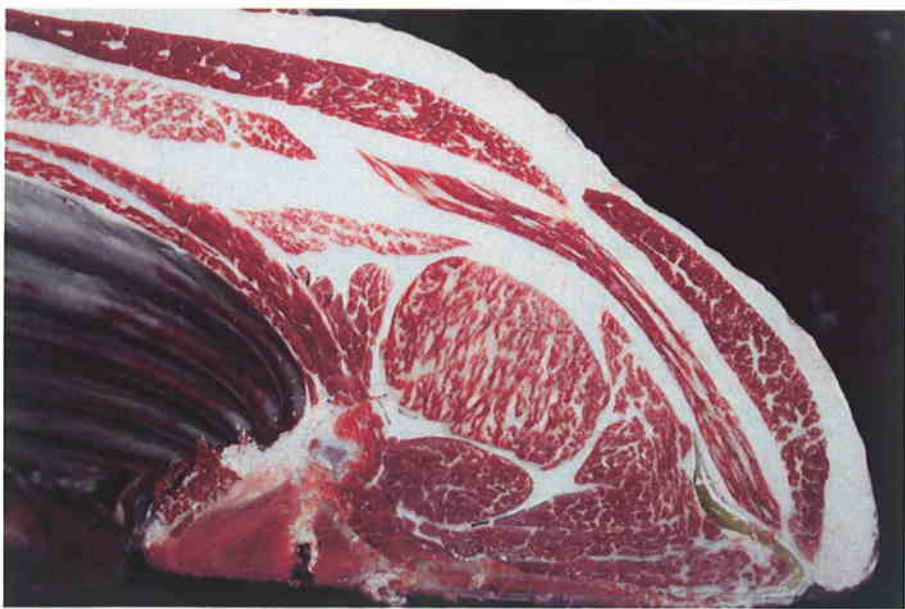
No 3 血統：福之国×福桜 格付成績：脂肪交雑 5 A-5