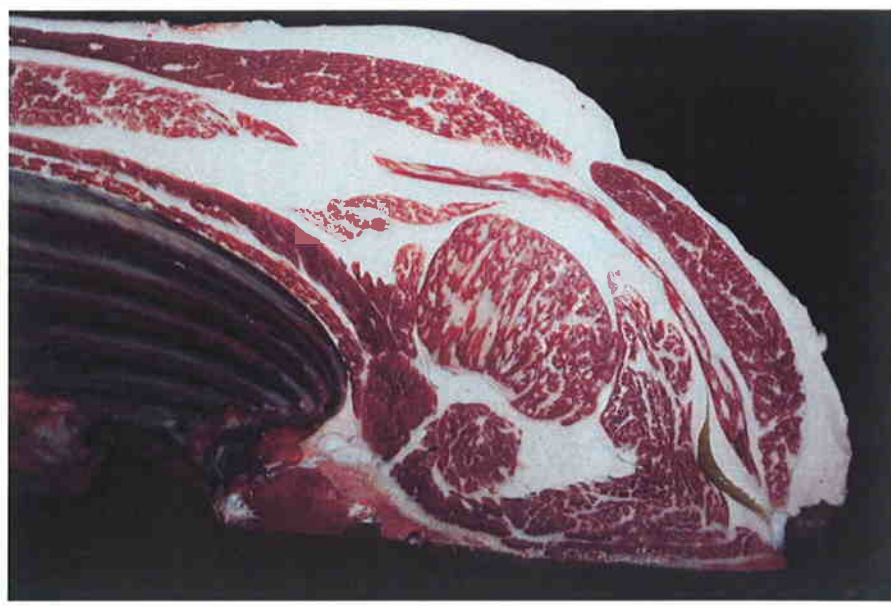
No 8 血統：福之国×福桜 格付成績：脂肪交雑 5 A-5