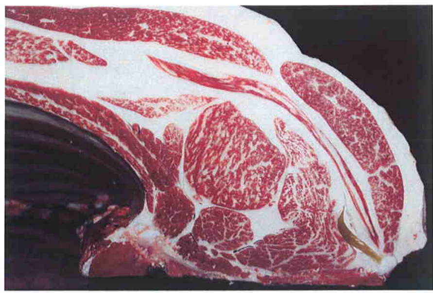
No 6 血統：上茂福×福桜 格付成績：脂肪交雑 4 A-5