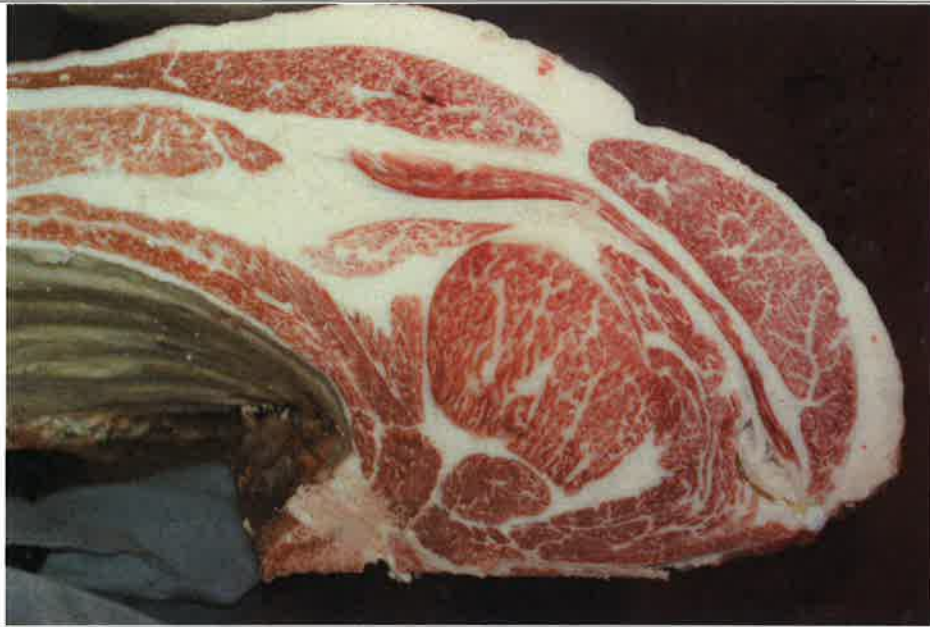
No 5 血統：忠富士×日向国 格付成績：A-5 BMSNo 9