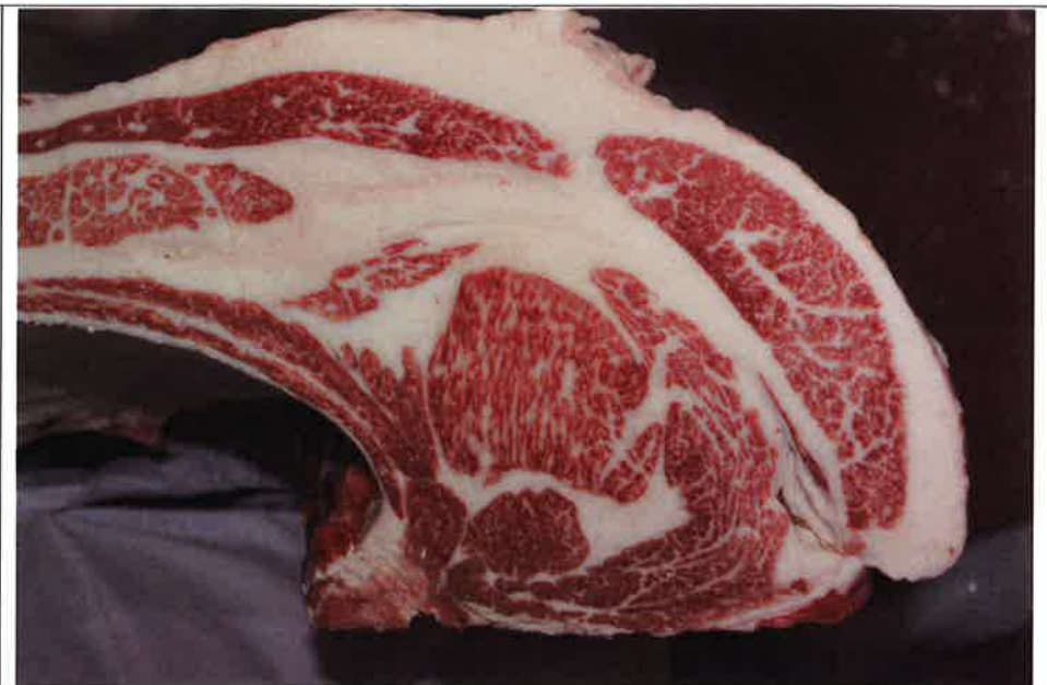
No 2 血統：忠富士×北国7の8 格付成績：A-4 BMSNo 6