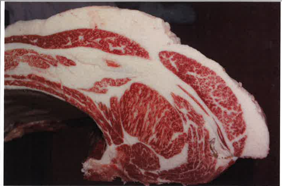
No 6 血統：忠富士×福茂 格付成績：A-4 BMSNo 7