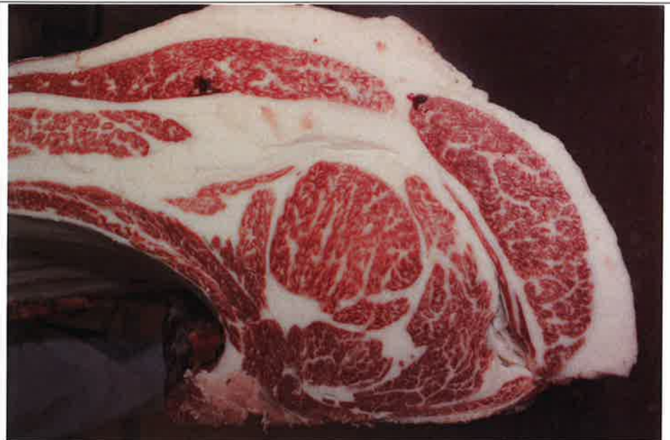
No 8 血統：福之国×福桜 格付成績：A-4 BMSNo 5