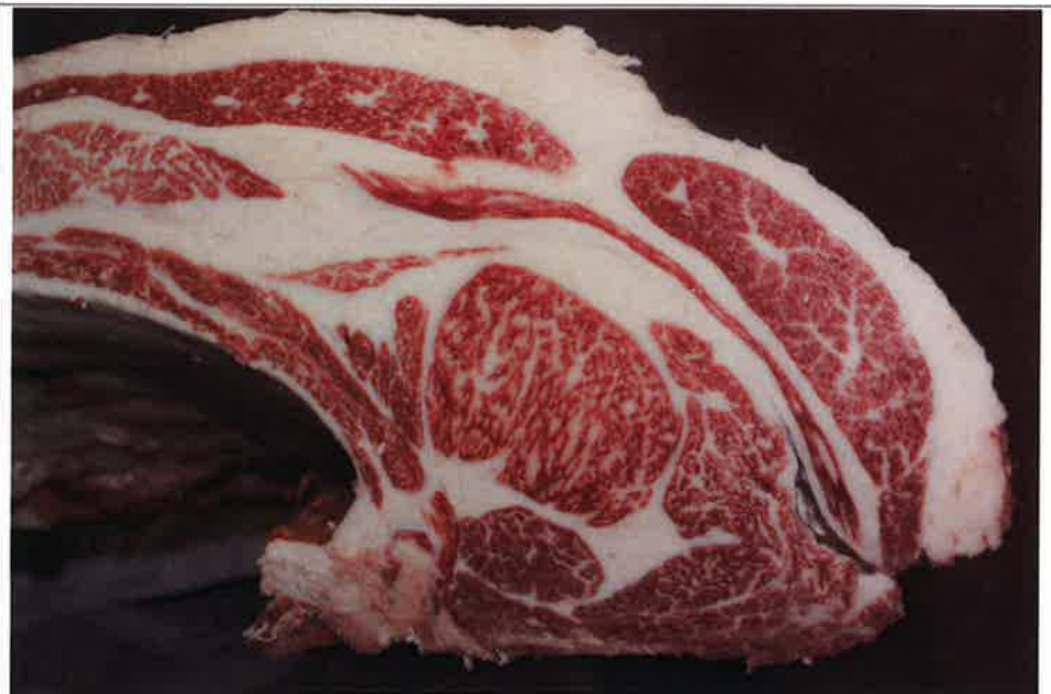
No 12 血統：忠富士×福桜 格付成績：A-4 BMSNo 5