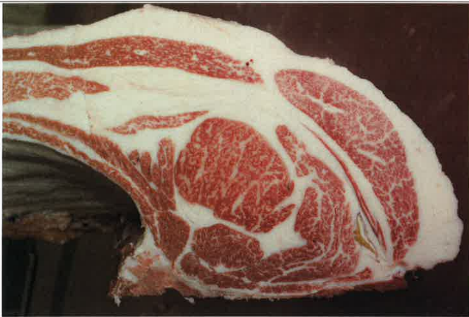
No 11 血統：忠富士×安平 格付成績：A-4 BMSNo 5