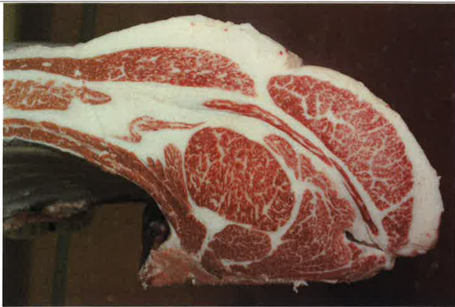
No 9 血統：勝平正×梅福6 格付成績：A-3 BMSNo 4