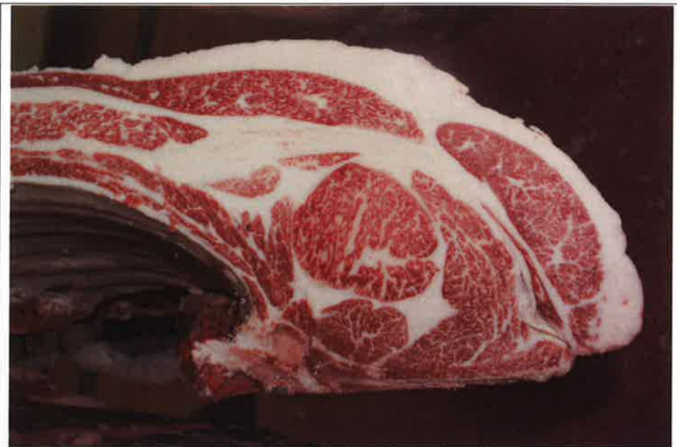
No 10 血統：忠富士×茂福 格付成績：A-4 BMSNo 5