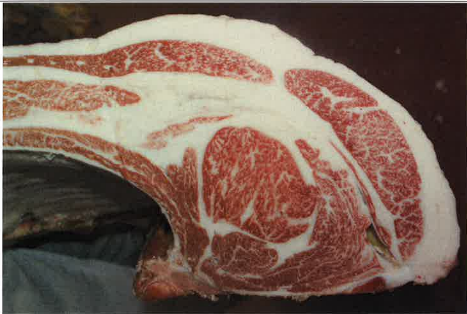
No 7 血統：福之国×福桜 格付成績：A-4 BMSNo 7