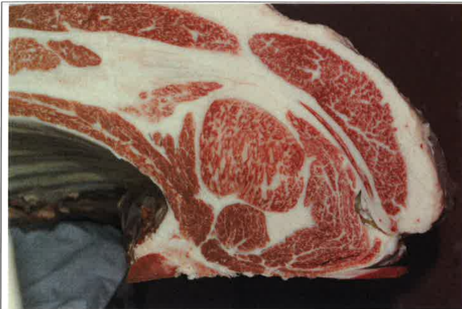
No 1 血統：忠富士×福桜 格付成績：A-5 BMSNo 8