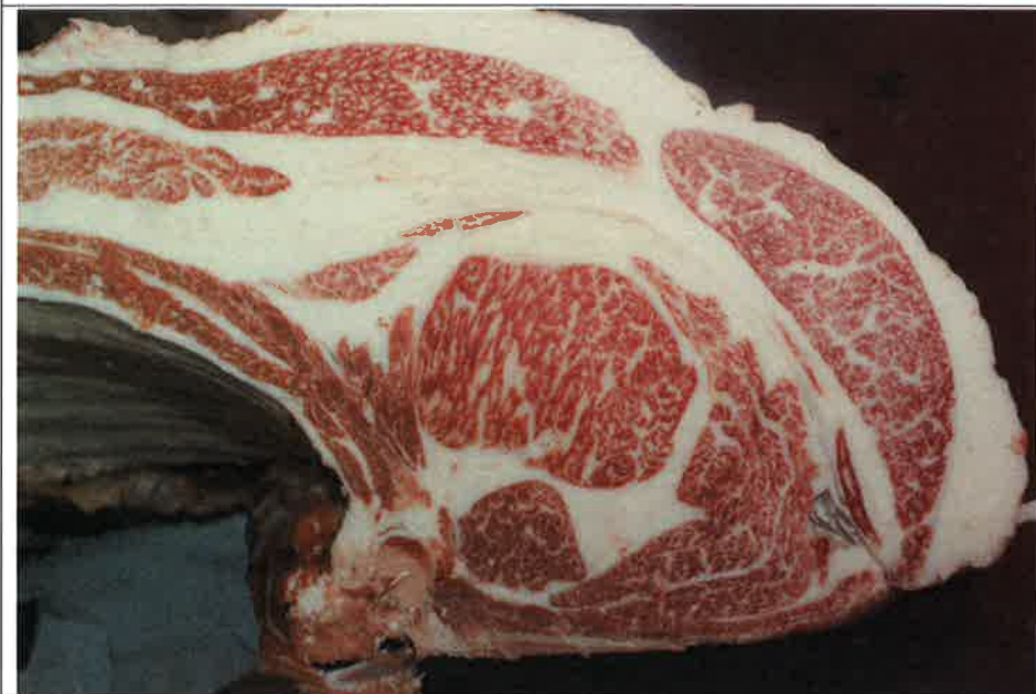
No 3 血統：福之国×福桜 格付成績：A-4 BMSNo 6